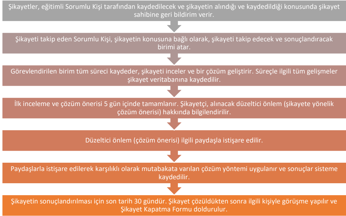
Şekil 2: Şikayet Yönetimi İş Akışı